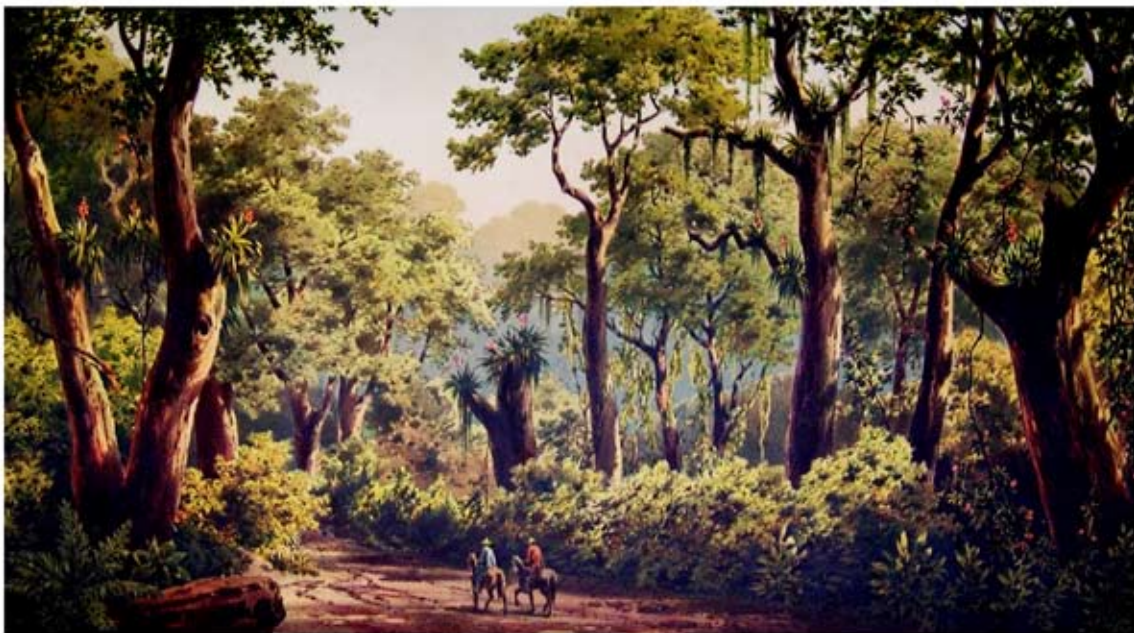
“Selva de Laureles en Tucumán”. Ilustración de Adolfo Methfessel en “Vues pittoresques de la Republique Argentine”, de Germán Burmeister, editado en 1881.

Pretendemos posicionar al Parque Percy Hill como un monumento natural de Yerba Buena que brinde además un contexto para el desarrollo de actividades culturales y educativas de bajo impacto que contribuya a la sensibilidad comunitaria en torno a la naturaleza. El apelativo de “aula de la naturaleza” representa esta visión, ya que integra el concepto de conservación de la biodiversidad con el de propender a una mejor calidad de vida.