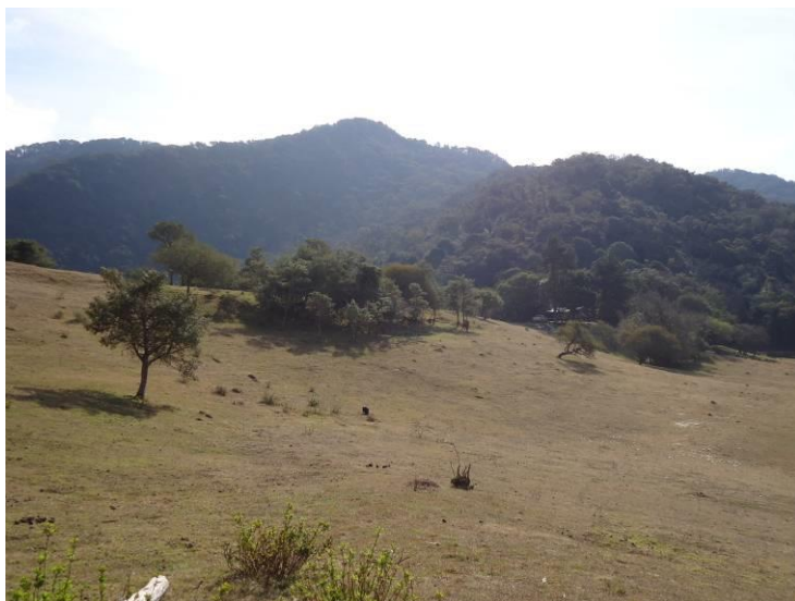
Tres Lagunas- Realización rompevientos

Las nuevas plantaciones y la mejora de las existentes provocarán un beneficio indirecto sobre los bosques nativos, permitiendo la disminución de la presión sobre la vegetación nativa y en algunos casos un doble beneficio como control del efecto erosivo de los vientos (cortinas rompevientos) y control erosión hídrica (contenciones para evitar desmoronamientos en épocas de lluvia).