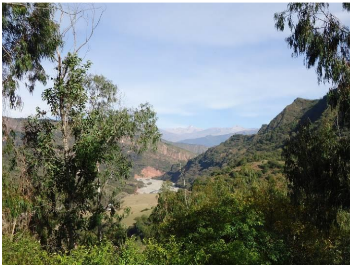
Corral de Piedra