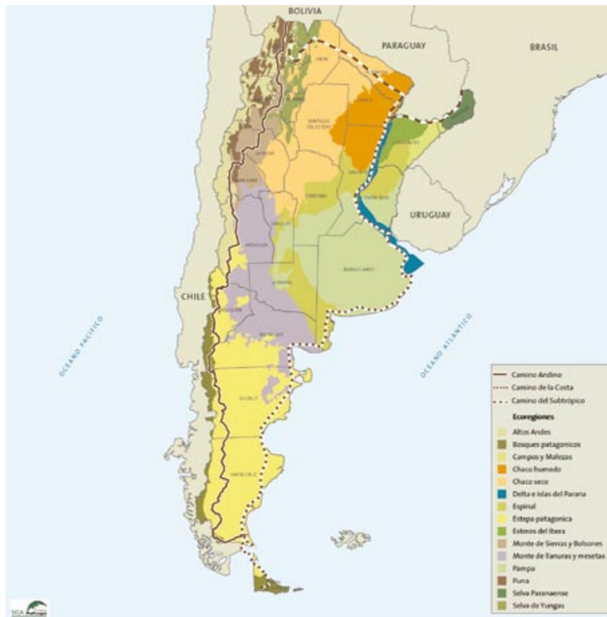
LOS "CAMINOS DEL BICENTENARIO" Y LAS ECOREGIONES DE ARGENTINA.