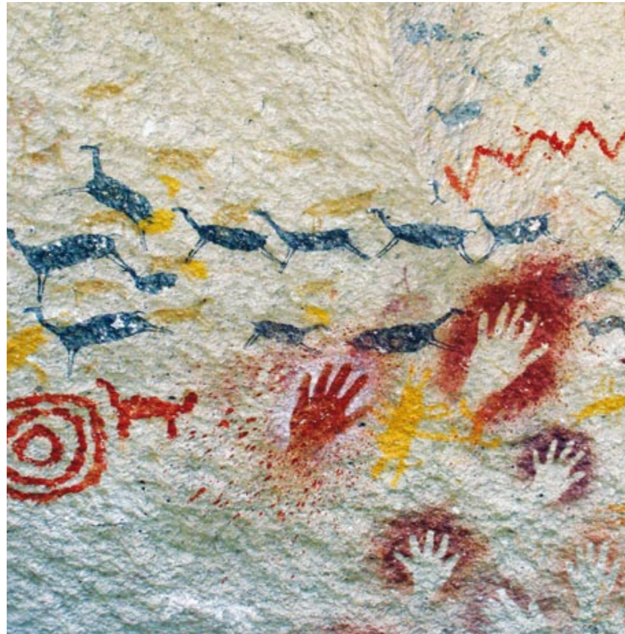
CUEVA DE LAS MANOS. PROVINCIA DE SANTA CRUZ.