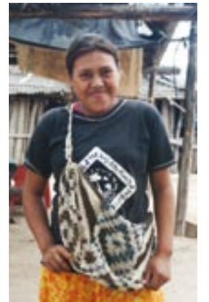
MUJER PILAGÁ. PROVINCIA DE FORMOSA.

Con el reconocimiento constitucional de los derechos sobre la tierra de estas comunidades, previsto en la reforma de la Constitución Nacional del '94, hoy existe un reclamo generalizado de reconocimiento de la tenencia de la tierra sobre vastas superficies de la Argentina, tarea no menor que deberá realizarse próximamente para tener claridad sobre el destino de muchas de nuestras áreas naturales, de sus poblaciones ancestrales y sobre nuestro destino productivo. Mientras este tema no se resuelva profundamente, la incertidumbre legal y fáctica seguirá dominando el paisaje de buena parte del "interior" de nuestro país, particularmente en las extensas áreas marginales de nuestra geografía, potenciando nuestras limitaciones y una innecesaria conflictividad creciente.