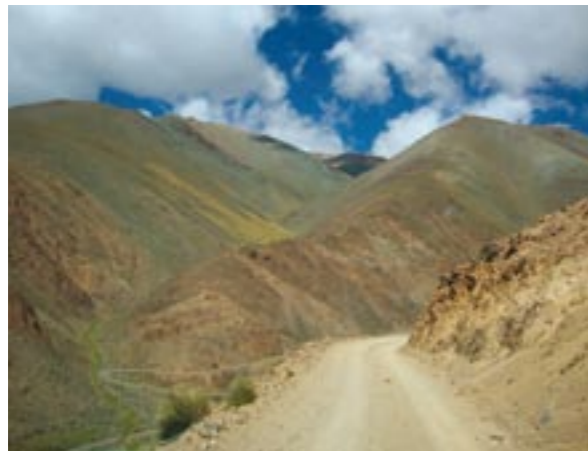
ABRA DEL ACAY. PROVINCIA DE SALTA.