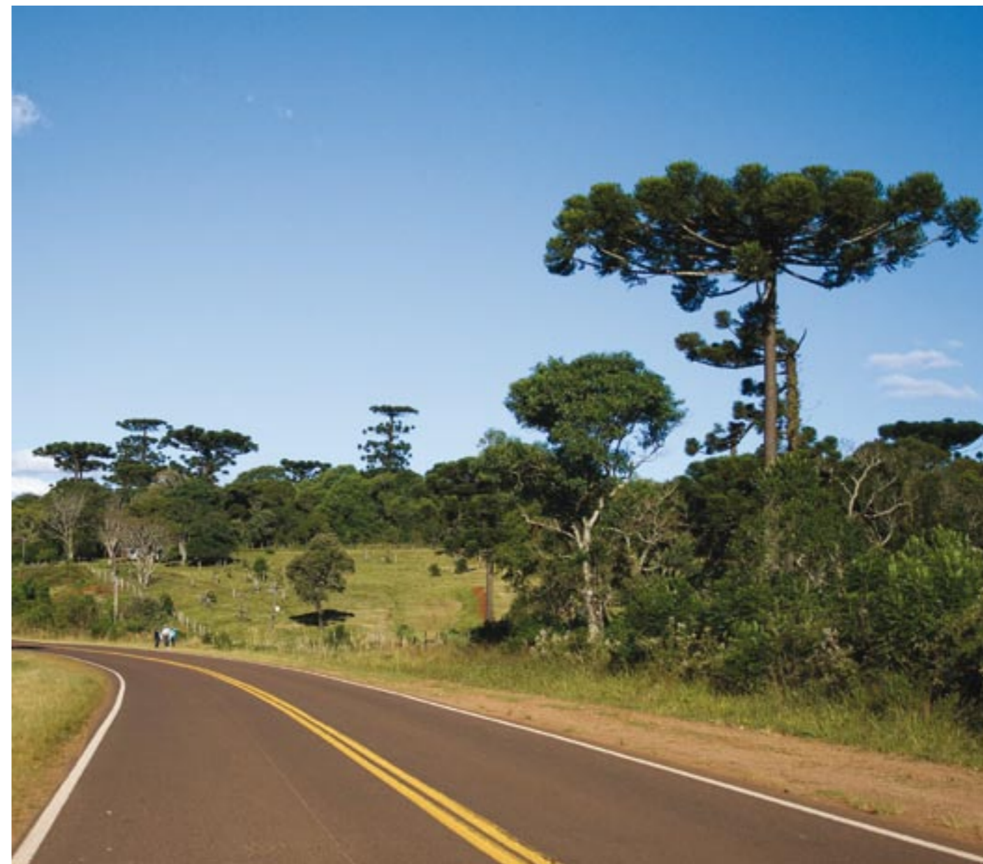
ARAUCARIAS EN SAN PEDRO. PROVINCIA DE MISIONES.