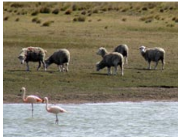
OVEJAS Y FLAMENCOS. PROVINCIA DE SANTA CRUZ.