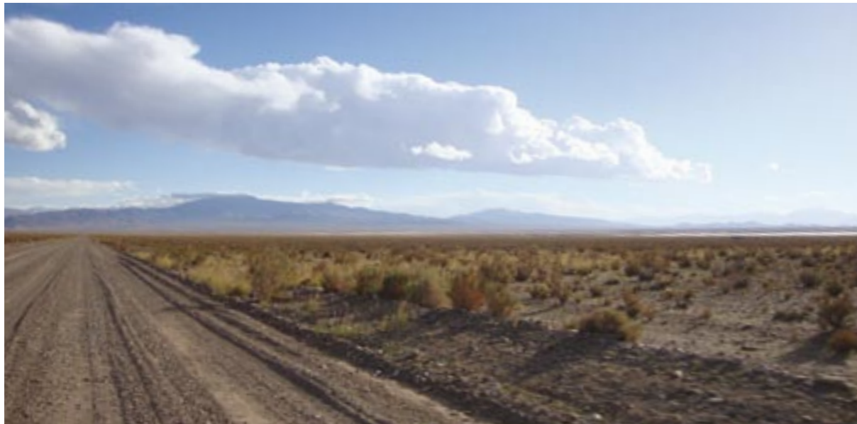
ESTEPA PUNEÑA. PROVINCIA DE JUJUY.

Argentina, un país donde confluyen la impronta indígena con una oleada migratoria que han modelado sus paisajes transformando grandes espacios naturales en sistemas productivos tradicionales y tecnificados.