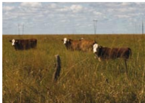
GANADO Y PASTIZAL. PROVINCIA DE CORRIENTES.