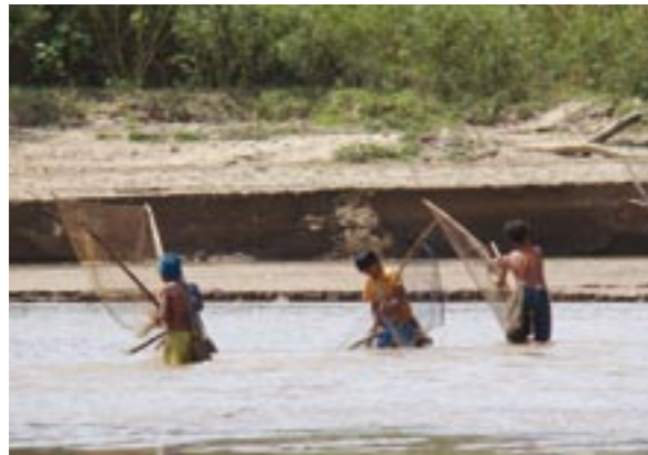
INDÍGENAS PESCANDO. PROVINCIA DE FORMOSA.