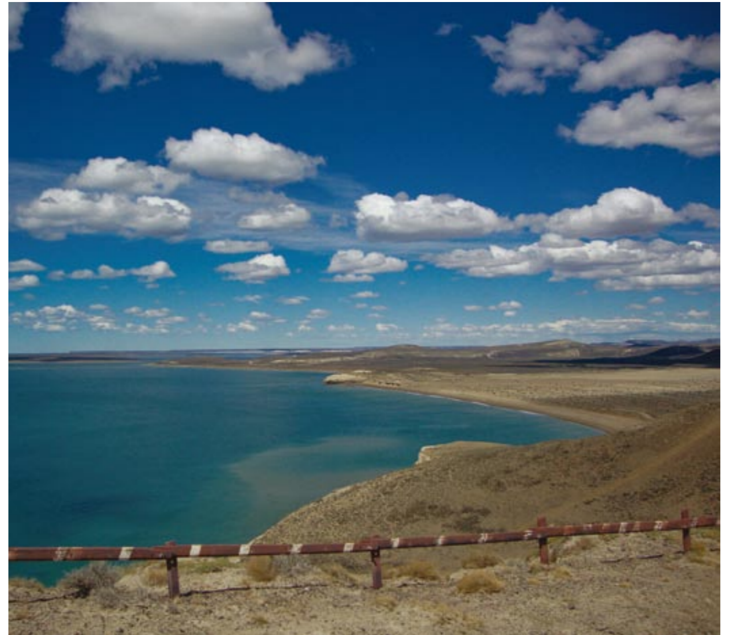
PENÍNSULA DE VALDÉS. PROVINCIA DE CHUBUT.