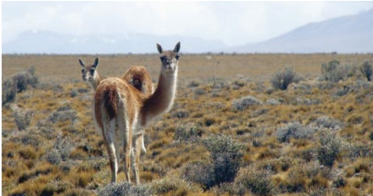
GUANACOS EN LA ESTEPA PATAGÓNICA. PROVINCIA DE SANTA CRUZ.