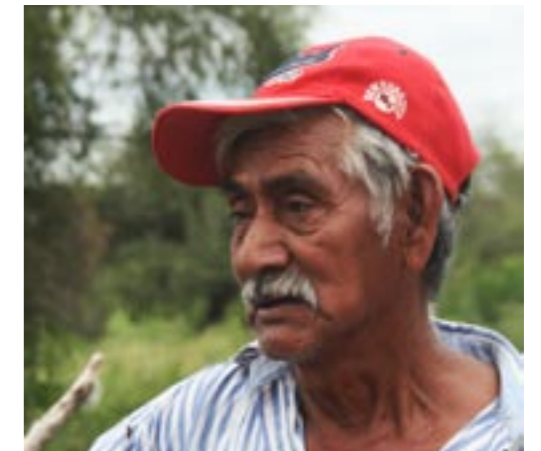
TOBA. PROVINCIA DE FORMOSA.