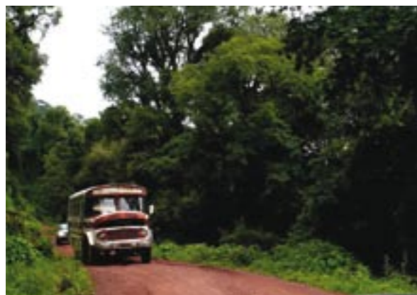
P. N. CALILEGUA. PROVINCIA DE SALTA.