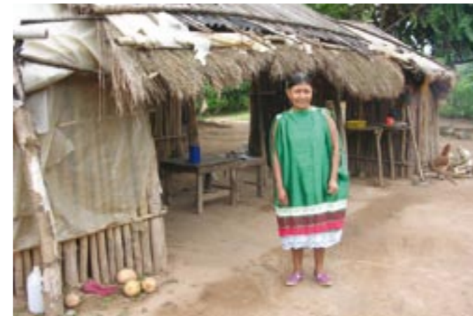
MUJER GUARAÑÍ. PROVINCIA DE SALTA.