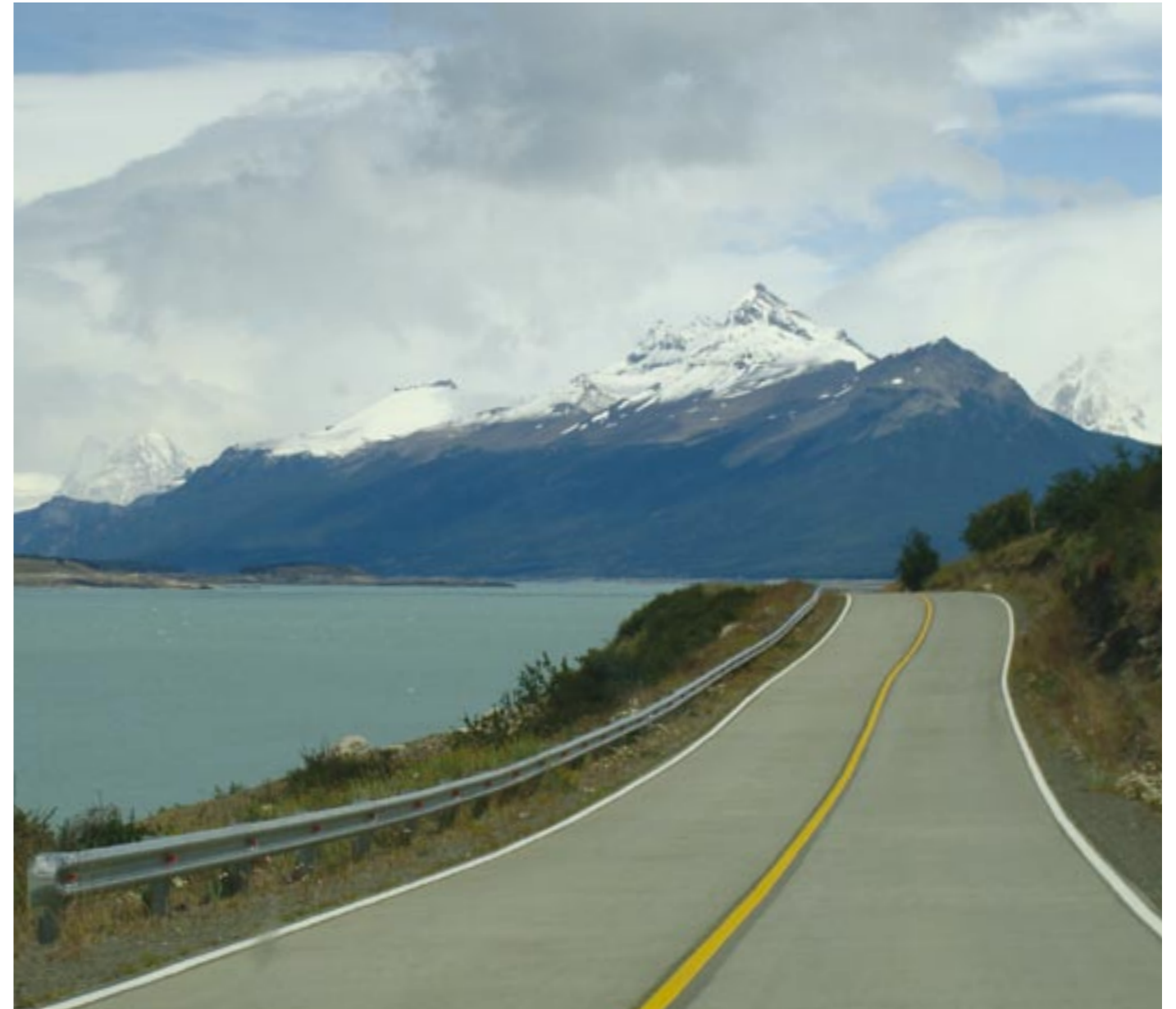
ACCESO AL PARQUE NACIONAL LOS GLACIARES. PROVINCIA DE SANTA CRUZ. FOTO DE GRACIELA ORZALI/PROYUNGAS.