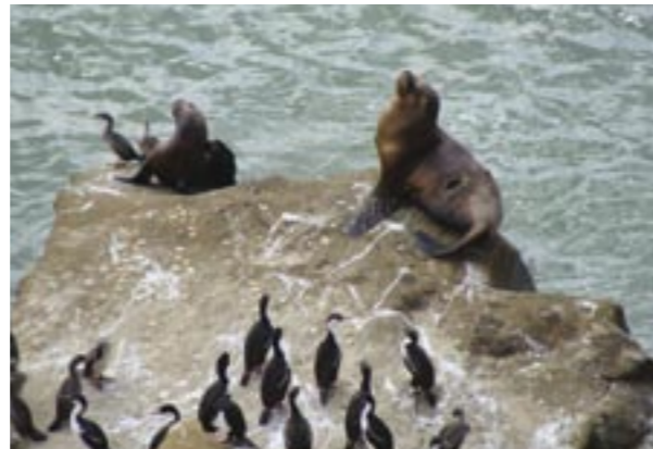
PROVINCIA DE SANTA CRUZ.