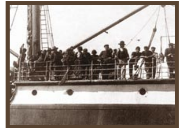
INMIGRANTES LLEGANDO AL PUERTO DE BUENOS AIRES (1911)