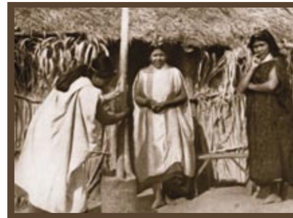
VIVIENDA GUARANÍ EN EL INGENIO SAN MARTÍN DE TABACAL - ORÁN (1946).

Esto, muy evidente en los grandes espacios de la Pampa Húmeda, es menos obvio en los extensos paisajes andinos y patagónicos, donde la historia del hombre y la naturaleza se modelaron imperceptiblemente por espacio de miles de años.