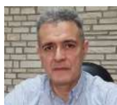
Yan Speranza Fundación Moisés Bertoni

El contexto social asociado a la sustentabilidad en el Gran Chaco y sus principales desafíos.